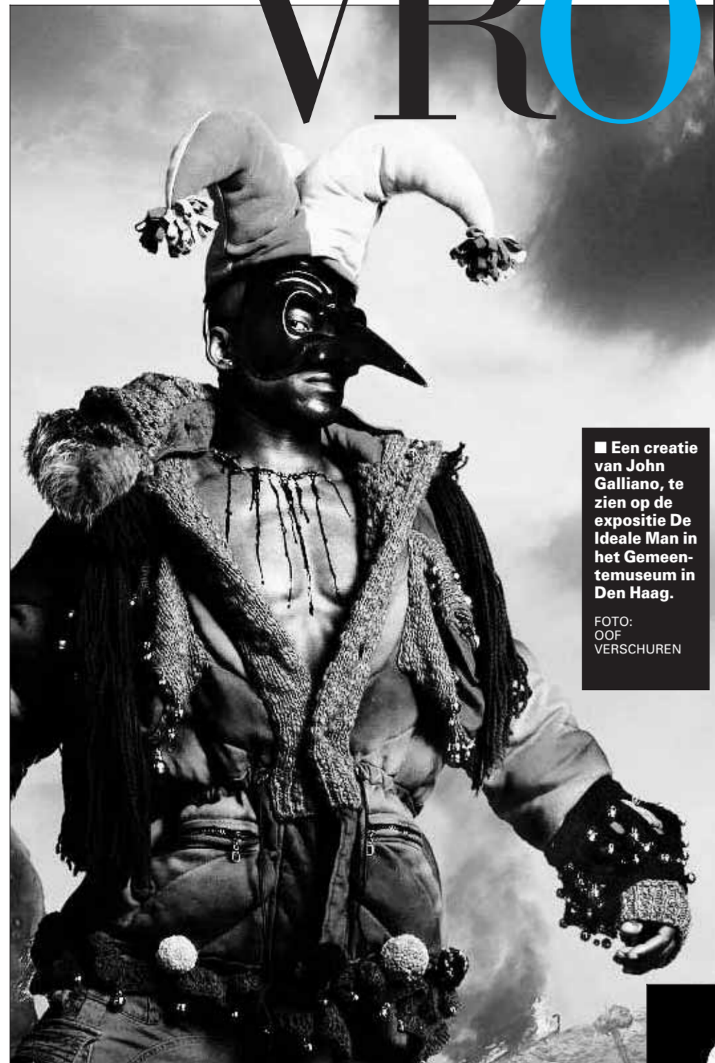
■ Een creatie van John Galliano, te zien op de expositie De Ideale Man in het Gemeentemuseum in Den Haag.

'Rond mijn eisprong heb ik meer zin in seks' Ga naar www.telegraaf.nl/vrouw