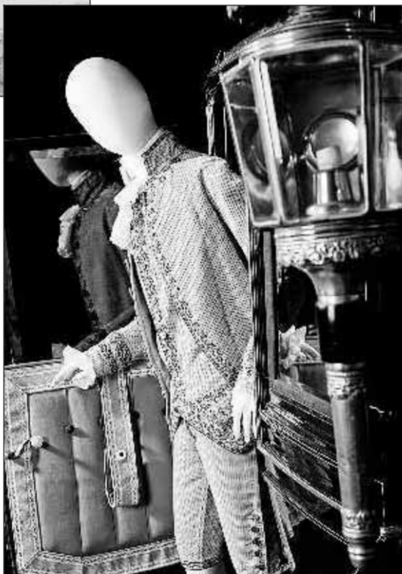
■ Collectie Gemeentemuseum Den Haag 1780/1785.

„We merken dat mannen bijzonder geïnteresseerd zijn in mode”, verklaart Christopher Bailey. „Mode is niet voor mijtes zoals voorheen werd gedacht. Ook echte kerels vallen als een blok voor fa-