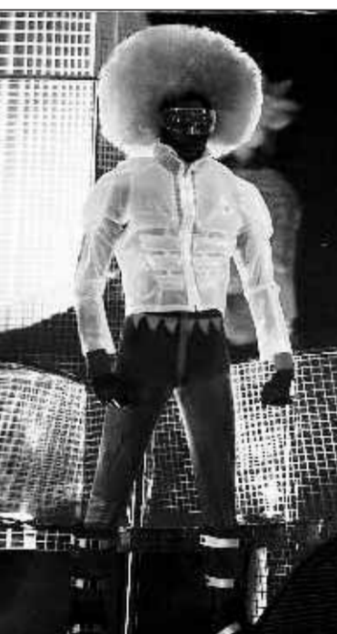
■ Superheroes tentoonstelling. Het jasje van Walter van Beirendonck is ook te zien bij De Ideale Man.

Tijdens de Pitti Uomo, de grootste mannenmodebeurs van Europa, en de internationale shows in Milaan en Parijs worden elk halfjaar de laatste trends gepresenteerd. Soms subtiel, zoals de ongevoerde jasjes die elk halfjaar nog lichter worden gemaakt, en soms opvallend, zoals blauw fluweel pakken en wijde broeken van katoen en kasjmier. „Vrouwenmode is en blijft